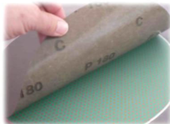
łatwo nakleić, łatwo usunąć!