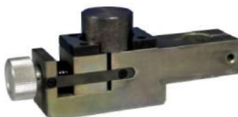
Standardowy zacisk ze średnimi szczękami