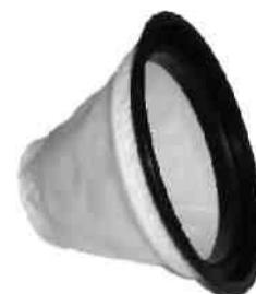
Ochrona silnika odciagu