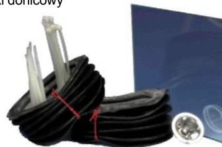
Zestaw części zamiennych

Szlifierka HK150.1 w połączeniu ze szlifierką talerzową HK350