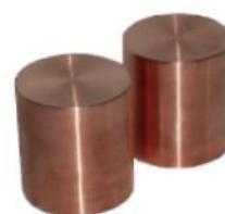
Bloki chłodzące z miedzi