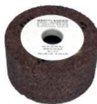
Korundowy kamień szlifierski donicowy