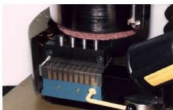
HK150 z uchwytem magnetycznym

Ręczna szlifierka wahadłowa ze stalową szafką i zintegrowaną pułapką iskrową